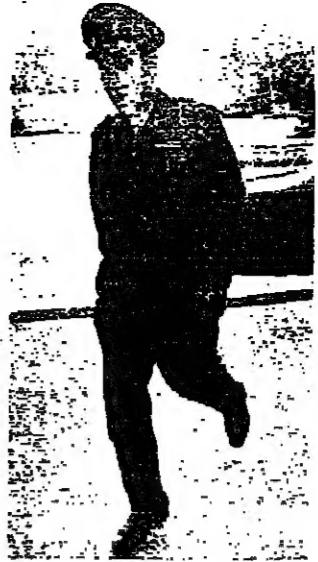
وزير الداخلية العماد نصرالله في قصر بعبدا

قال وزير الداخلية العماد نصر الله في بيان اذاعه امس ان شعار الحكومة الاول هو تأمين الامن وافي ما يلي نص البيان: ايها المواطنين الانزاء ايها القتيبون المخلصون على ارض الوطن ان الاحداث الالهية التي عصفت